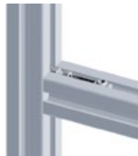
Fräsverbinder Profil 30 Milling Connector Profile 30